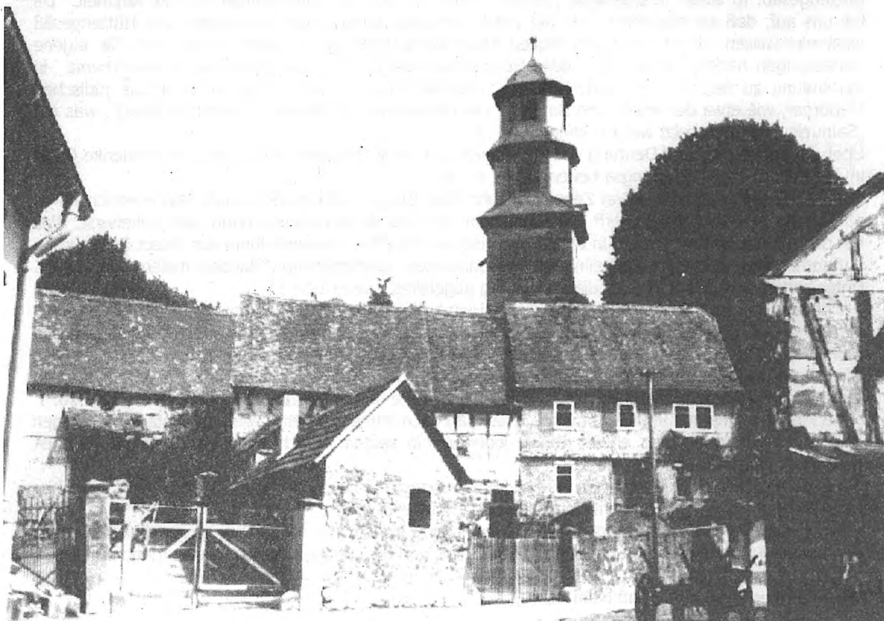
Foto: Blick zur Hüttengesäßer Kirche in den fünfziger Jahren. Wenn Sie ganz genau hinschauen, erkennen Sie an der Kirchturmmauer links außen eine Hölzklappe. Dort hing früher das Seil für das tägliche Glockengeläut. Der Neubau ganz links ist das ehem. Feuerwehrgerätehaus von Hüttengesäß.