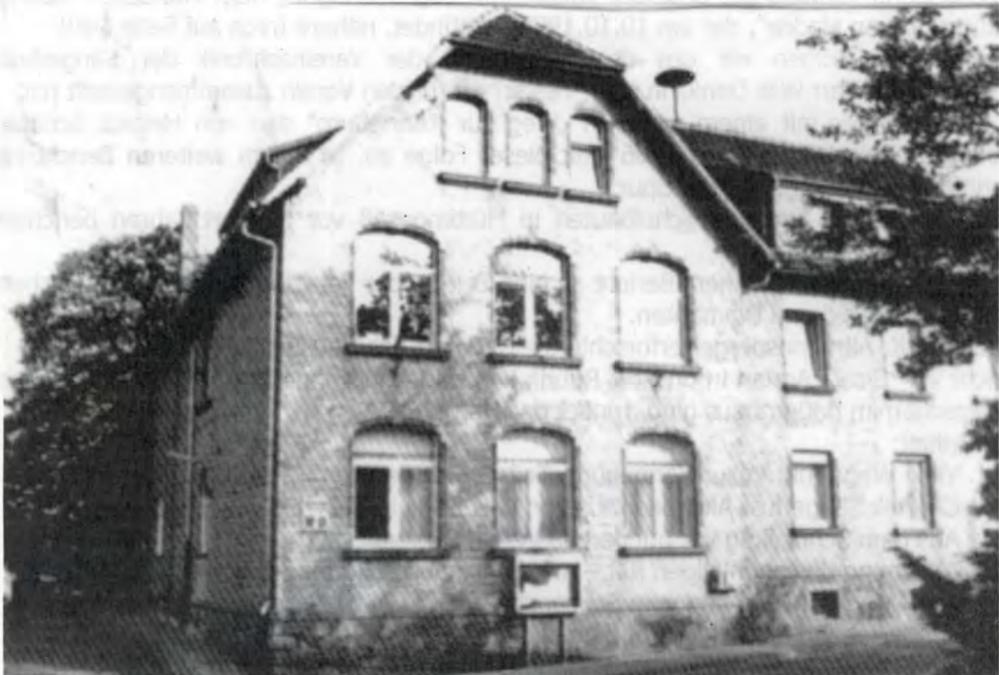
Foto: Das hundertjährige Schulhaus in der Schulstraße, heute Rathaus von Ronneburg.